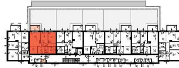
LAGE ÜBERSICHT OG II