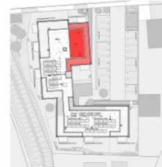
LAGE ÜBERSICHT STELLPLATZ