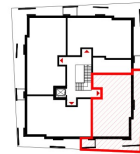
ÜBERSICHT 3. OBERGESCHOSS