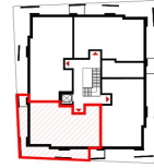
ÜBERSICHT 3. OBERGESCHOSS