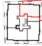
ÜBERSICHT 3. OBERGESCHOSS