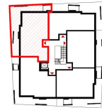
ÜBERSICHT 1. OBERGESCHOSS