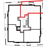
ÜBERSICHT 1. OBERGESCHOSS