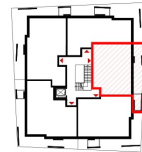
ÜBERSICHT 1. OBERGESCHOSS